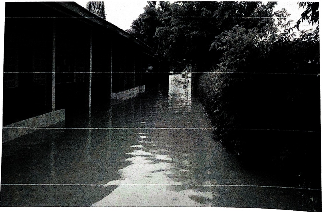
โรงเรียนบ้านปงสนุก อ.เวียงสา จ.น่าน