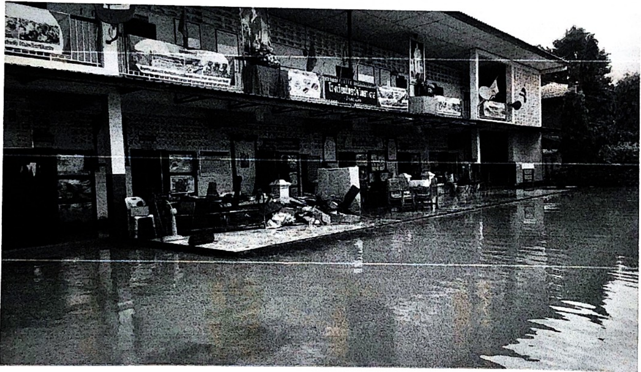
รูปภาพความเสียหายเบื้องต้นจากอุทกภัย จ.น่าน