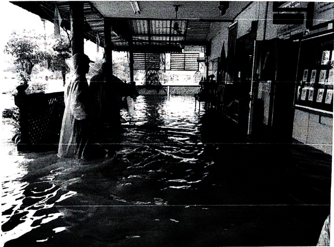
โรงเรียนบ้านน้ำบัว อ.เวียงสา จ.น่าน