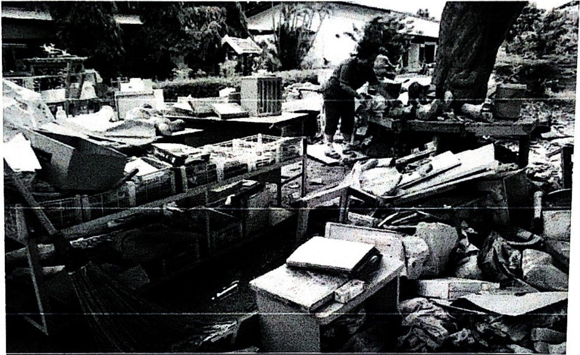
รูปภาพความเสียหายเบื้องต้นจากอุทกภัย จ.น่าน