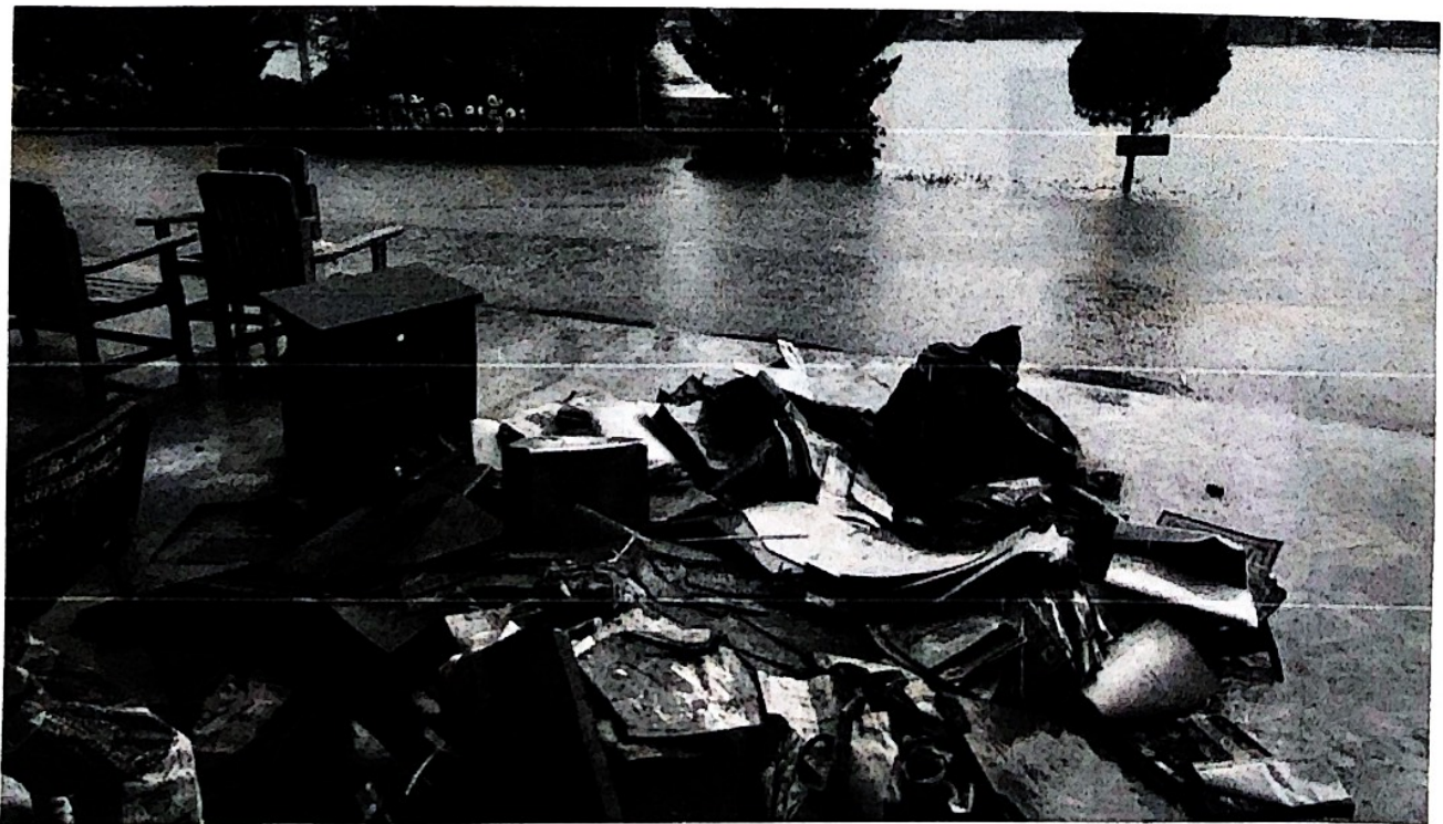
โรงเรียนบ้านไหล่น่าน อ.เวียงสา จ.น่าน