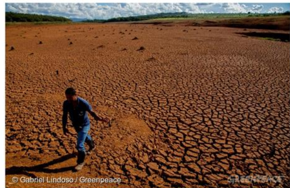
10 วิกฤตการณ์สำคัญจากสภาพภูมิอากาศที่เกิดขึ้นในปี 2558