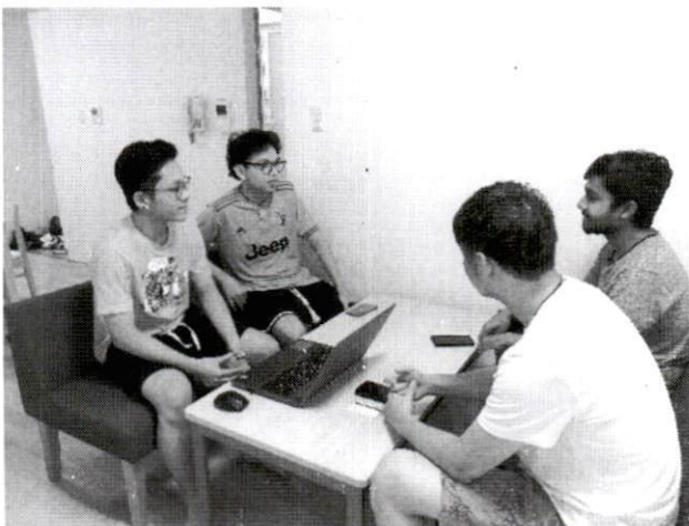
In the Unit