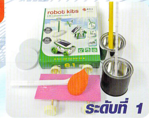
ระดับที่ 1