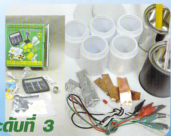
ระดับที่ 3