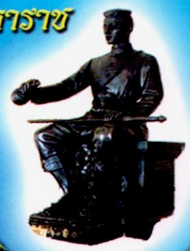
สมเด็จพระนเรศวรมหาราช