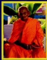
พระวราภานมุนี (ทลวงคาสะหัง)