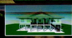
4. อาคารอนุรักษ์ 2