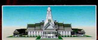
1. พระตำหนักสมเด็จพระนเรศวรมหาราช