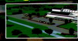
5. ลานจอดรถ