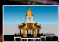
2. หอพระสองห้อง