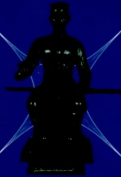
พระพุทธรชินราช(องค์คัมแบง) หน้าตัก ๕.๙ นิ้ว จำนวนการจกสร้าง ๑,๔๑๐ องค์ สั่งขององค์ละ ๗,๙๙๙ บาท