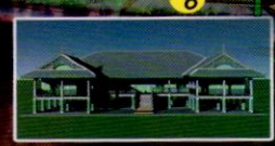
3. อาคารอนุรักษ์ 1