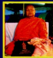
ทลวงปูแปลก โรจโน