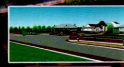
6. ประตูทางเข้า

พิธีมหาจักรพรรดิพุทธธาภิเษก ณ พระวิหารพระพุทธชินราช วันที่ ๑๘-๑๙ สิงหาคม ๒๕๕๘ ชั้น ๔-๕ กำแพงแก้ว