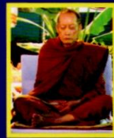
พระวิมลภาทิมนต์มุนี