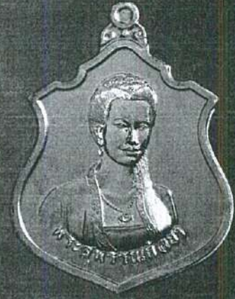
ด้านหลัง พระสุพรรณกัลยา