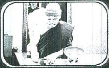
พระอธิการลี อตุลา

ที่ปรึกษาเจ้าคณะภาค ๘ / เจ้าอาวาสวัดพระธาตุผาซ่อนแก้ว