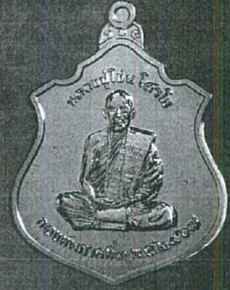
ด้านหน้า หลวงปู่โง่น โสโย