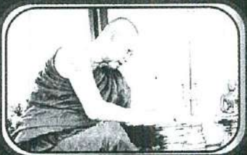
ท่านเจ้าคุณพระภาวนาวิเชียรปราการ วิ.

เจ้าอาวาสวัดปากเหมือง อ.สารภี จ.เชียงใหม่