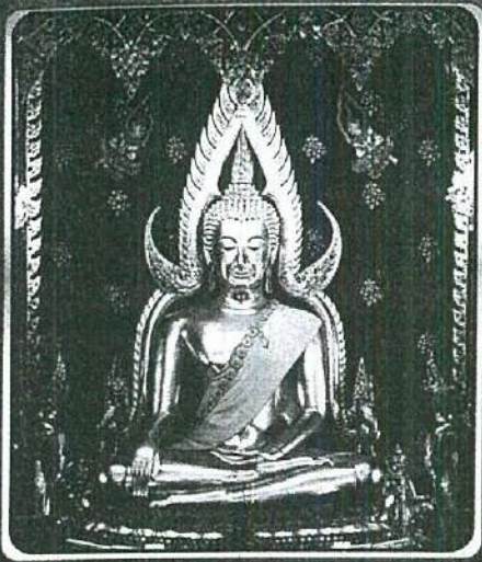
พระพุทธรูปชินราช

พระพุทธรูปชินราช เป็นพระพุทธรูปที่สวยงามที่สุดในโลก สร้างโดยเทวดาชั้นผู้ใหญ่ ปี พ.ศ. ๑๔๙๔ พระมหากษัตริย์ราชธานีไทย โปรดให้สร้างพระพุทธรูปขึ้น ๓ องค์ คือ พระพุทธรูปชินสิทธิ์ พระศรีศาสดา และพระพุทธรูปชินราช ปรากฏว่าหลังจากแกะเทอะหุนออกแล้ว สร้างสำเร็จเพียง ๒ องค์ คือ พระพุทธรูปชินสิทธิ์ และพระศรีศาสดา ส่วนพระพุทธรูปชินราช หาสว่างสำเร็จไม่ พระมหากษัตริย์ราชธานีไทย และข้าราชการบริพารในวัง สมณ ชี พราหมณ์บาอินทร์ บาพรหม์ บาพิษณุ บาราชสิทธิ์ บาราชกุล พร้อมช่างเมือง เชียงแสน เมืองหริภุญชัย เมืองศรีสาขานาลัย และเมืองสวรรค์โลก ร่วมกันรักษาศิล ๘ ตั้งจิตอธิษฐาน ขอให้เทพดาชั้นผู้ใหญ่ เบื้องบนสวรรค์ ชั้นดุสิตมหาปราสาท ! ... ท้าวสักกะเทวราช องค์อมรินทร์ ได้รับทราบถึงคำอธิษฐาน จึงได้จำแลงแปลงกายเป็นเทพดาปะชาวเสด็จลงมาเมืองพิษณุโลก ประทับยืน แหนหินที่ 30 นับจากหน้าพระวิหาร ทำการปั้น แต่ง หล่อ พระพุทธรูปชินราช สร้างสำเร็จในปี พ.ศ. ๑๙๐๐ วันพฤหัสบดี ขึ้น ๘ ค่ำ เดือน ๖ ปีมะเส็ง แกะเทอะหุนออกแล้วปรากฏว่า ทองสัมฤทธิ์ ทองสำริด จากสวรรค์เบื้องบน ไหลแล่นเต็มองค์ สุกปลั่ง สวยงาม เรื่องฉัพพรรณรังสี เป็นที่อัศจรรย์ ยิ่งนัก