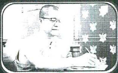
พระราชรัตนสุริ (ชวัญรัก)

เจ้าคณะจังหวัดพิษณุโลก วัดพระศรีรัตนมหาธาตุ วรมหาวิหาร ประธานสงฆ์ พิธีพุทธาภิเษก