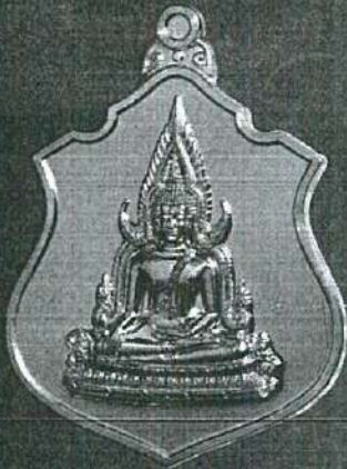
ด้านหน้า พระพุทธชินราช