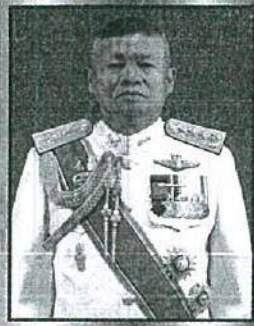
พลโท ประสาน แสงศิริรักษ์ แม่ทัพภาคที่ 3 ประธานจัดสร้าง